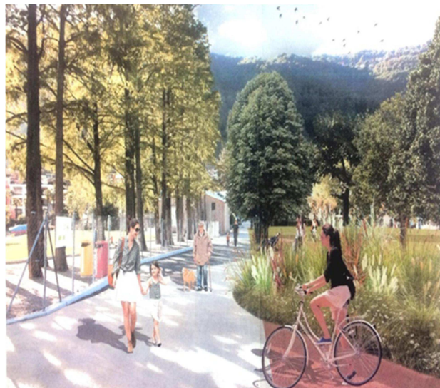
Immagine evocativa del progetto

La proposta d'intervento adempie ai criteri qualitativi per la concessione del sostegno cantonale.